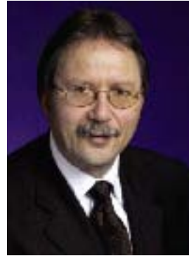
Karlheinz Weimar Hessischer Minister der Finanzen

Die 30. aktualisierte Auflage des „Steuerwegweisers für gemeinnützige Vereine und für Übungsleiter/-innen“ enthält die Neuerungen aufgrund des Gesetzes zur weiteren Stärkung des bürgerschaftlichen Engagements, das rückwirkend zum 01.01.2007 in Kraft getreten ist, ergänzt durch Beispiele, praktische Tipps und Erläuterungen. Zur Verdeutlichung sind die Änderungen und Neuerungen kursiv gedruckt und mit einem grauen Randstrich versehen. Von den mit dem Gesetz verbundenen steuerlichen Verbesserungen zum Gemeinnützigkeits- und Spendenrecht – z.B. Erhöhung von Freibeträgen für wirtschaftliche Aktivitäten, Einführung einer steuerfreien Pauschale für steuerbegünstigte Nebentätigkeiten, Verbesserungen des Spendenabzugs – profitieren insbesondere die vielen kleinen und mittleren Vereine. Der auch im Internet unter www.hessen.de abrufbare Steuerwegweiser – unter der Rubrik „Infomaterial“ –, soll den vielen Verantwortlichen der rund 35.000 in Hessen ansässigen gemeinnützigen Vereine und Stiftungen, aber auch den Übungsleitern und Übungsleiterinnen bei der steuerlichen Behandlung helfen. Sofern Sie darüber hinausgehende Fragen haben, wenden Sie sich bitte an Ihr Finanzamt. Sie finden das für Ihren Verein zuständige Finanzamt im Anhang 2 dieser Broschüre.